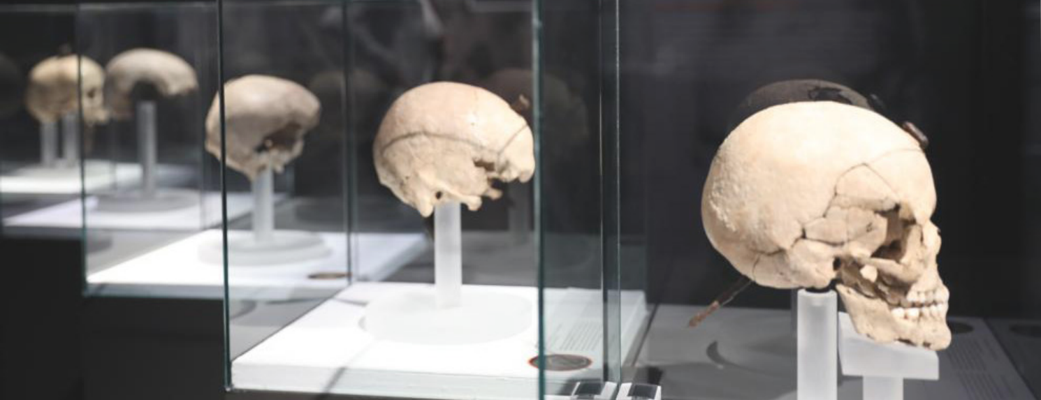
"Cabezas Cortadas. Símbolos de poder"