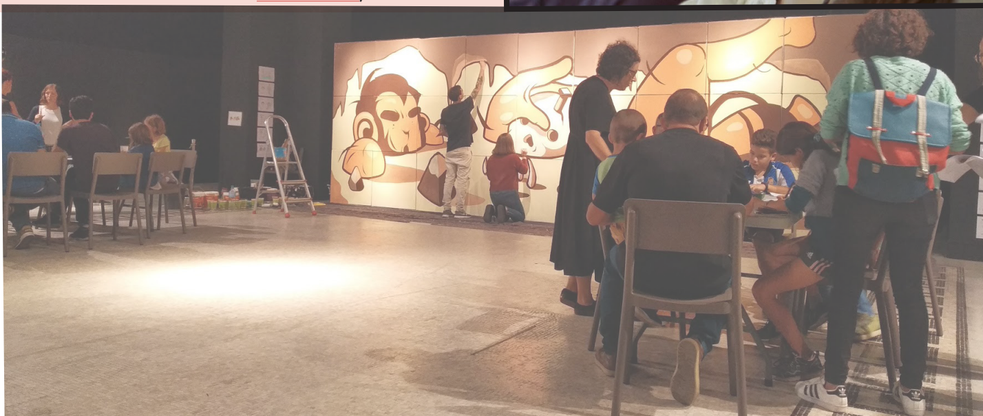
Big Daw 2019. Elaboración de un mural colaborativo con el colectivo artístico Twee Muizen.