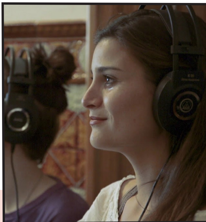
Festival GREC 2019. Binaural , Marala Trio.